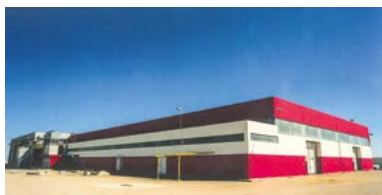
Prodotti e stabilimento Bella Contadina

B ella Contadina è il marchio commerciale di “Cirillo Group Spa”, azienda conserviera nata nel 2010, ma frutto di un’esperienza pluridecennale, con due stabilimenti produttivi, uno a San Giovanni Rotondo e l’altro, di recente realizzazione, ad Ortanova.